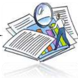
Gráfico 15 – Número de Pedidos de Restituição de IVA