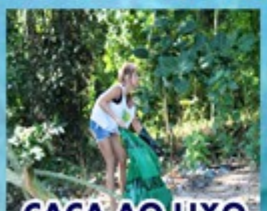
CAÇA AO LIXO