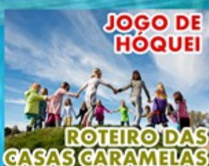
JOGO DE HÓQUEI ROTEIRO DAS CASAS CARMELAS