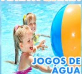
JOGOS DE ÁGUA