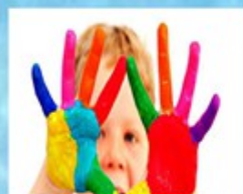
PINTA A QUINTA